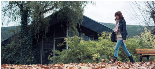
Abb. 3: Mélanie spaziert durch Laub